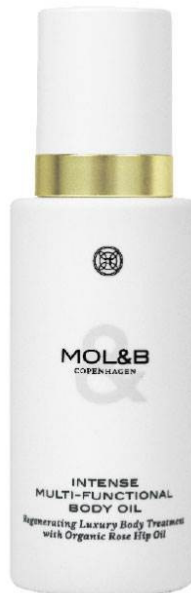
Intensive Multi-Functional Body Oil, MOL&B Copenhagen, 299 kr.

gennemfugtet, uden at den føles fedtet. Den indeholder gode og nærende vitaminer, antioxidanter og essentielle fedtsyrer, der styrker og plejer huden.