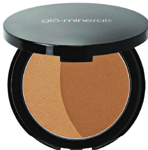
Bronze Duo, Sunkiss, GloMinerals, 425 kr.

Jeg bruger makeup fra Glo Minerals, hvor min favorit er Sunkiss Bronzer, der fremhæver kindbenene på en skøn måde, uden at det bliver for meget. Der er en lille bitte smule shimmer i, som ser superfint ud på huden.